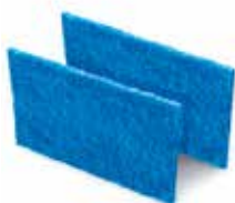
Acessórios ultra filtração para resíduos de maior tamanho