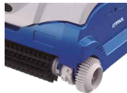
Sistema de rodas dentadas Quick Conect