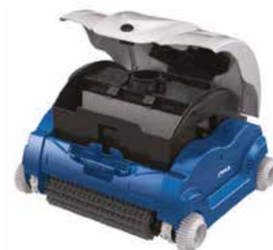
Fácil acesso ao painel de filtração