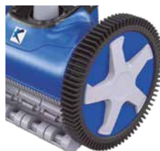
Rodas de tamanho superior

Para piscinas residenciais e todo o tipo de superfícies